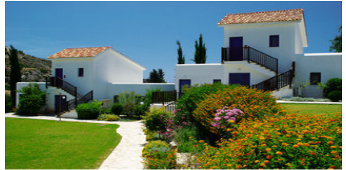
Das Hylatio Village

STRAND Leicht abschüssiger, langgestreckter Sand-/Kiesstrand. Strandduschen und Umkleidemöglichkeiten. Liegen und Sonnenschirme (gegen Gebühr). Am Strand vielfältige Wassersportmöglichkeiten z.B.