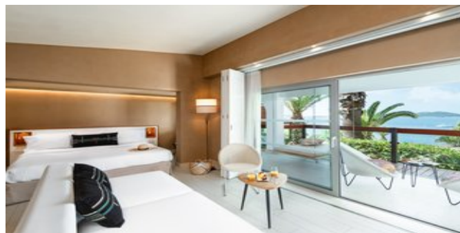
Wohnbeispiel Bungalows mit privatem Pool

WELLNESS Gegen Gebühr: Eagles Beauty & Wellness Center by Elemis. Pool, Sauna, Jacuzzi,