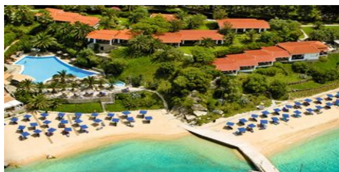
Ein Teil der Hotelanlage direkt am Meer