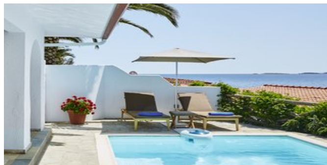
Wohnbeispiel Bungalows mit privatem Pool

SUPERIOR ZIMMER (RC/RB) Ca. 25 qm. Lage im Haupthaus. Grundausstattung wie die Standard Zimmer. Marmorbad/WC, Föhn, Bademantel und Slipper, Naturkosmetik-Badeartikel. Strandtücher. Balkon mit Meerblick (= RC) oder Gartenblick (= RB). Einzelzimmer mit Gartenblick.