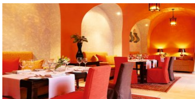
Im "Kamares" Restaurant