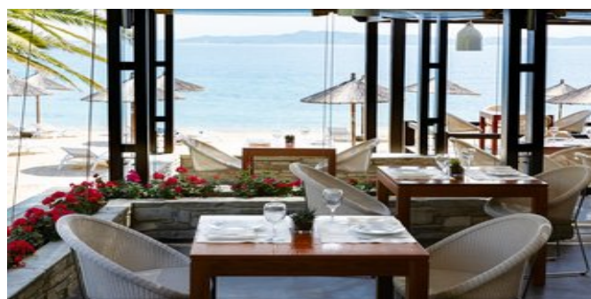
Im "Armyra" Restaurant