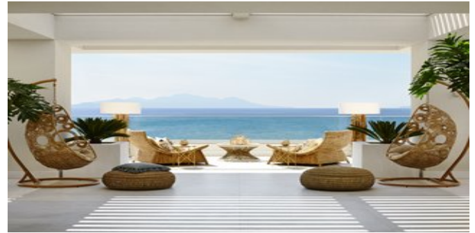
Auf der Veranda