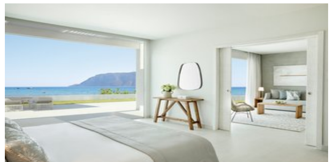
Wohnbeispiel Deluxe One Bedroom Bungalow Suiten