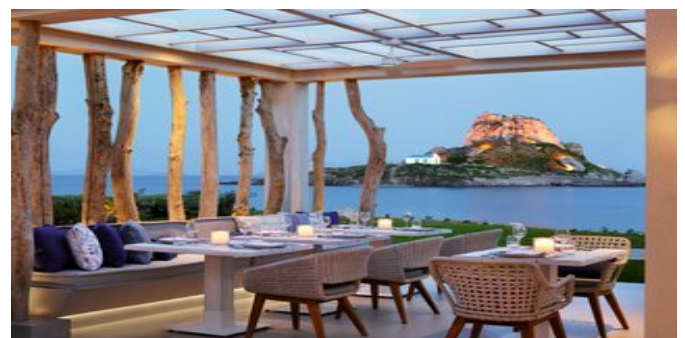
Im Restaurant "Ouzo"