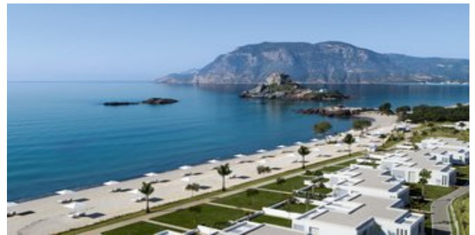
Blick auf den Strandbereich