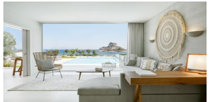
Wohnbeispiel Deluxe One Bedroom Bungalow Suiten