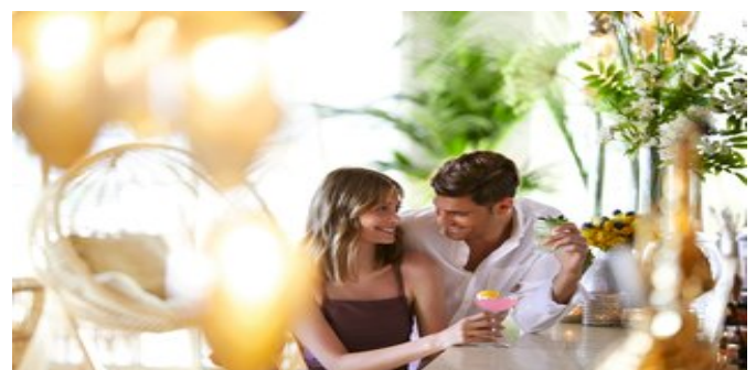
In der Lobbybar