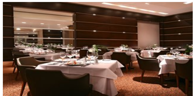
Das Castellania Restaurant