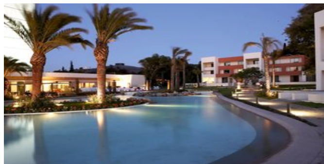
Die Anlage Rodos Palace Resort

EXECUTIVE ZIMMER (RA/RB) Ca. 45 qm. Lage im 1. bis 7. Stock des Executive Flügels. Klassische Einrichtung. Grundausstattung wie die