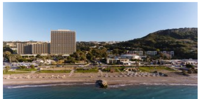
Blick auf den Strandbereich