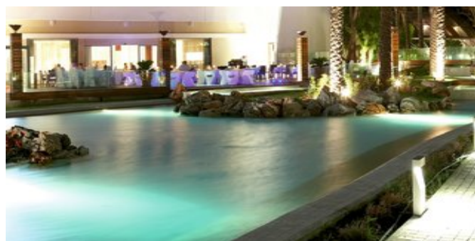
Eines der Restaurants