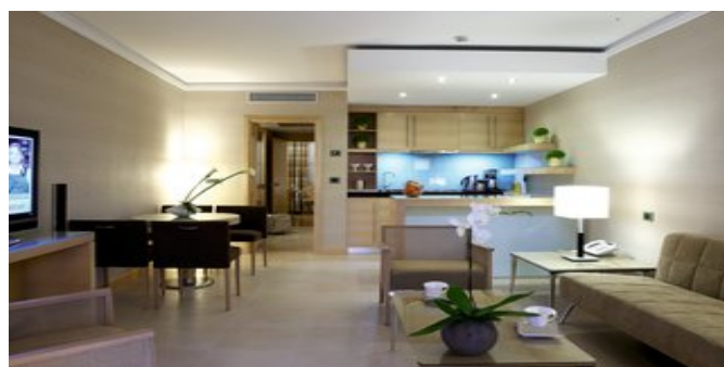
Wohnbeispiel Garden Suite