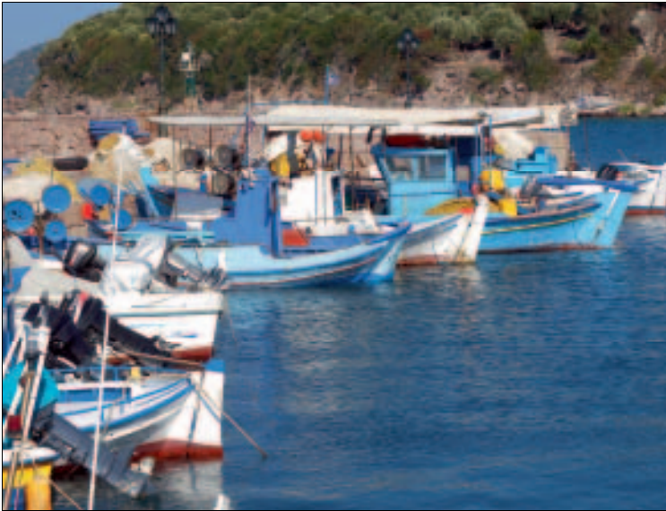
Farbenprächtig: der kleine Hafen von Skála Sikaminéas

gewohnt und spricht perfekt Deutsch; eigentlich plant sie ja, das Objekt eines Tages zu verpachten, aber nur, sofern sich auch ein würdiger Nachfolger findet. Die Familie vermietet auch ein Haus oben in Sikaminéa. Geöffnet ganzjährig außer über Weihnachten und Neujahr. Ab Mitte Juli und den August über ist, wie im ganzen Ort, mit Engpässen zu rechnen. DZ etwa 35–45 €, nach einer eventuellen Renovierung vielleicht eine Kleinigkeit mehr. Das Frühstück geht extra. ☎ 22530 55301, www.gorgonahotel.gr.