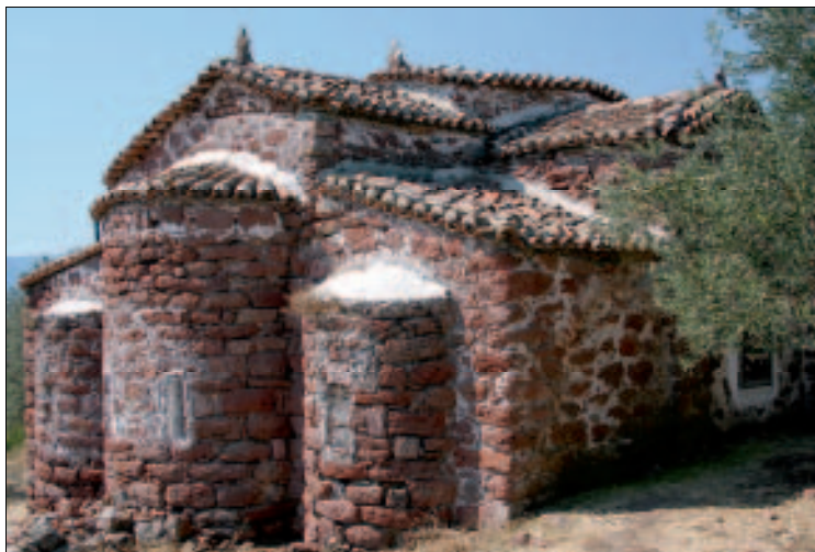
Uraltes Kirchlein: Ágios Stéfanos