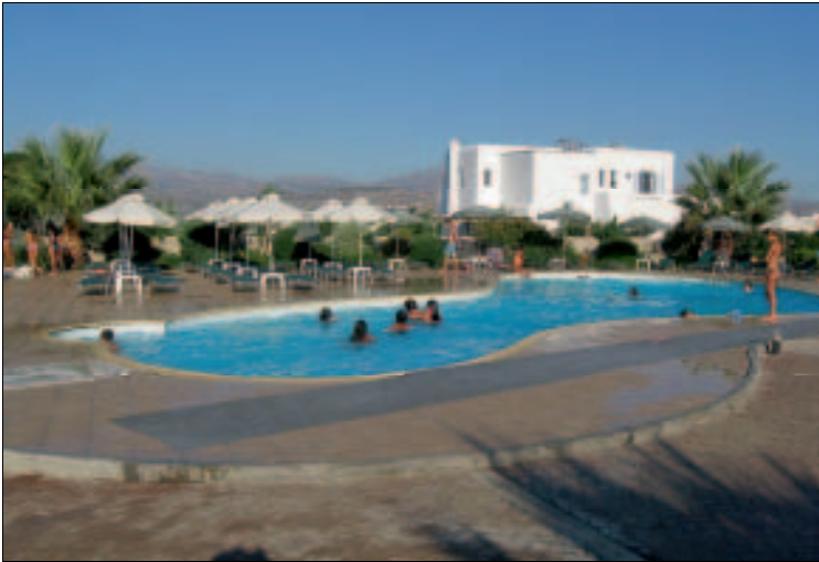
Im Aqua Fun Water Park

wachsene als Begleitperson ohne Zutritt zu den Rutschen und zum Pool gratis). Wifi gratis. Tägl. 11–19 Uhr. ☎ 22850-25050, www.aquafun.gr .