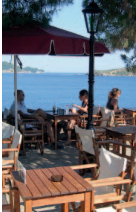
Kafeníon Bouúrtzi: wunderschöner Platz am Meer

Kirche Tris Ierarchés (Mitrópolis): die Hauptkirche der Stadt an der gleichnamigen Platía oberhalb der westlichen Hafentfront. Die reich verzierte Altarwand gotischen Stils stammt ebenso wie das Gebäude von 1846, doch viele ihrer Ikonen sind weitaus älter. Überall Rundbögen mit Heiligenbildern auf den Pfeilern und Ikonen der Heiligen Dreifaltigkeit (griech.: Tris Ierarchés), oft in Oklad. An den Wänden befinden sich Darstellungen vom Leidensweg Christi. Von der Decke reicht ein Kronleuchter mit einem Durchmesser von annähernd vier Metern!