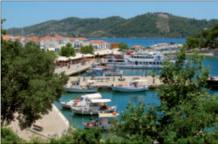
Blick auf den alten Hafen in der Stadt Skiáthos

Während sich die Neuankömmlinge schwertun, das richtige Angebot auszuwählen, stürmen bereits jene Menschen die Fähre, für die der Urlaub schon zu Ende geht. Der Spuk ist aber auch schnell wieder vorbei. Keine zehn Minuten nachdem das Schiff den Hafen verlassen hat, kehrt Ruhe ein – vorerst. Denn wenn die Sonne untergegangen ist, geht die Show erst richtig los: Zwischen den Häfen an der Paralía , in der Odós Polytechniou , der Papadiamántis -Straße und in der östlichen Hafengebucht Richtung Ammoudiá gibt man sich locker, frivol, beschwingt und ausgelassen. Sehen und gesehen werden heißt die Devise. Kontakte sind gefragt und Popmusik dröhnt vor allem aus den Open-Air-Bars östlich des Hafens. Langeweile kennt man nicht, und die Nacht endet erst, wenn die Straßenbeleuchtung ausgeschaltet wird. Mitte August ist der Höhepunkt der Saison, des Rummels und auch der Preise erreicht.