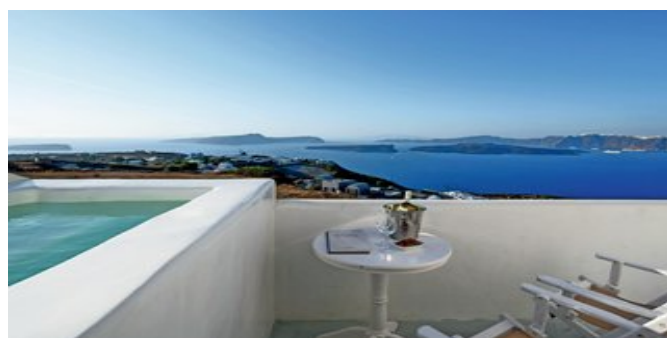
Terrasse mit Jacuzzi und Meerblick