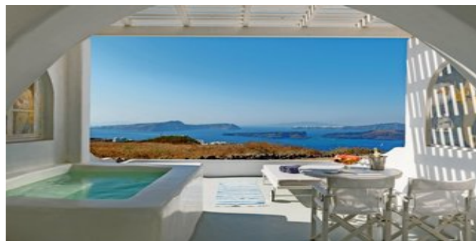
Wohnbeispiel Deluxe Suiten Outdoor Jacuzzi

FAMILY ELEGANT MAISONETTEN PLUNGE POOL (UH) Ca. 48 qm. Für 2-5 Personen. Grundausstattung wie die Comfort Suiten. Kombiniertes Wohn-/Schlafraum mit Sofabett, 1 separater Schlafraum mit Kingsize-Bett und 1 offener Schlafbereich mit Doppelbett auf einer eingezogenen Zwischendecke. Dusche/WC, Föhn,