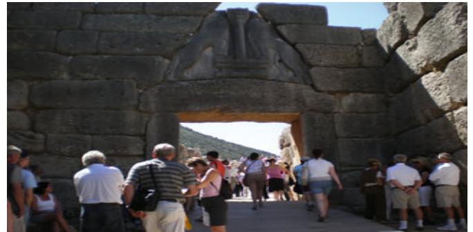
Löwentor von Mykene