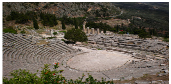
Theater von Delphi