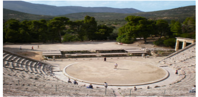
Theater von Epidaurus

Fahrt nach Máti/Néa Mákri (ca. 173 km/ca. 2 Std).