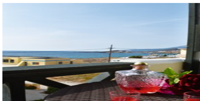
Blick von der Anlage