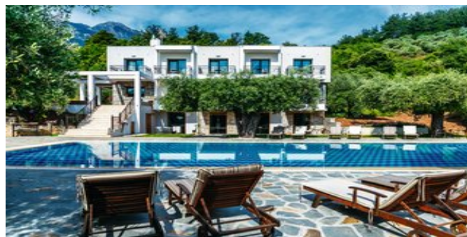
Das Hotel Ipsario Garden

VERPFLEGUNG ÜF (reichhaltiges Frühstücksbuffet von 8.30-11.30 Uhr).