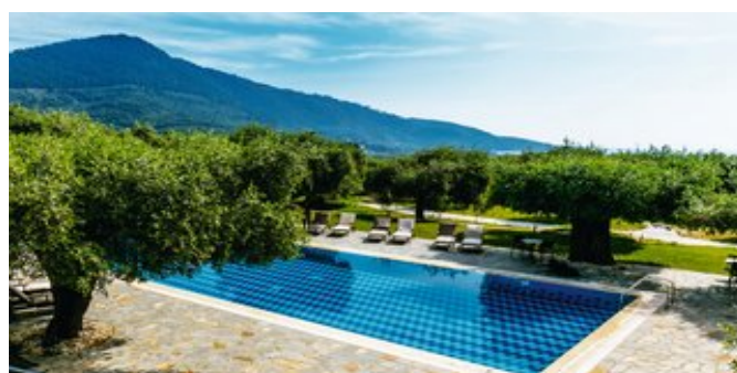
Blick auf den Pool