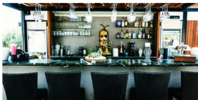
An der Bar