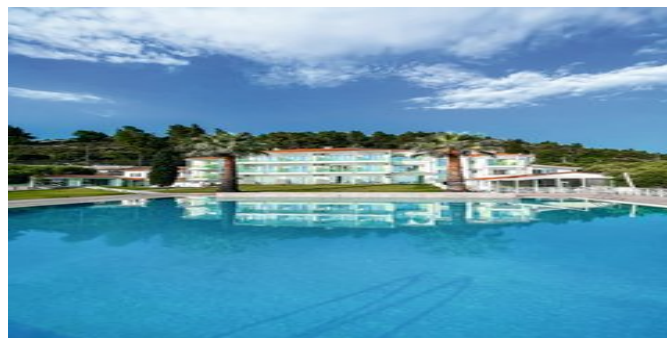
Das Lily-Ann-Boutique Hotel