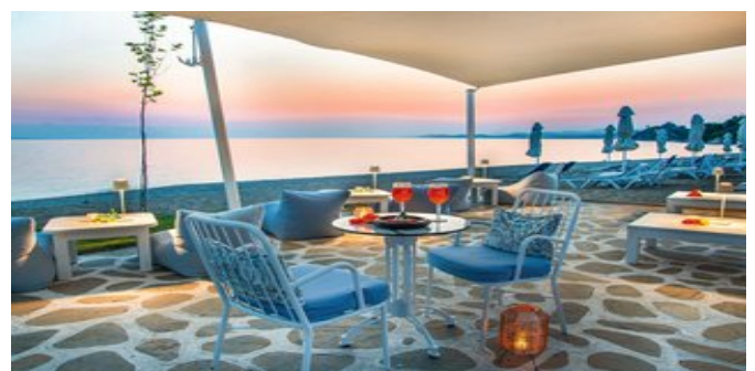
An der Strandbar