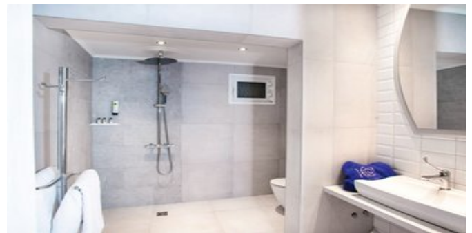
Wohnbeispiel - Badezimmer