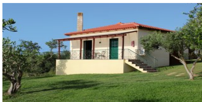
Eines der Ferienhäuser