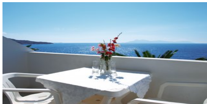
Auf dem Balkon