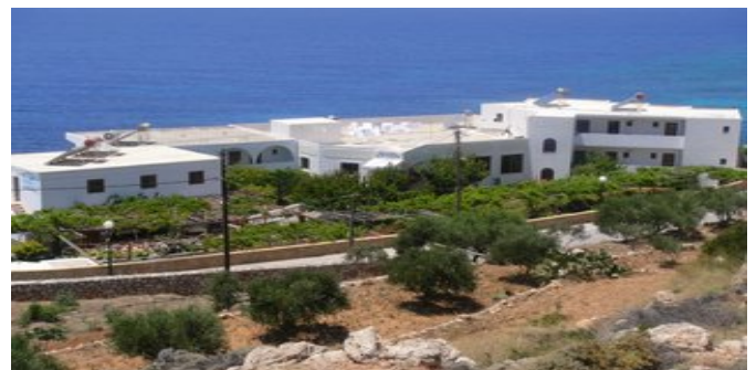
Das Hotel Krinos