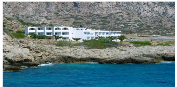
Das Hotel Krinos