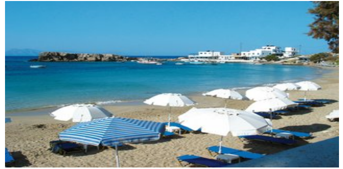
Strand von Lefkós