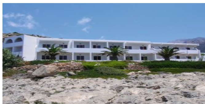
Das Hotel Krinos