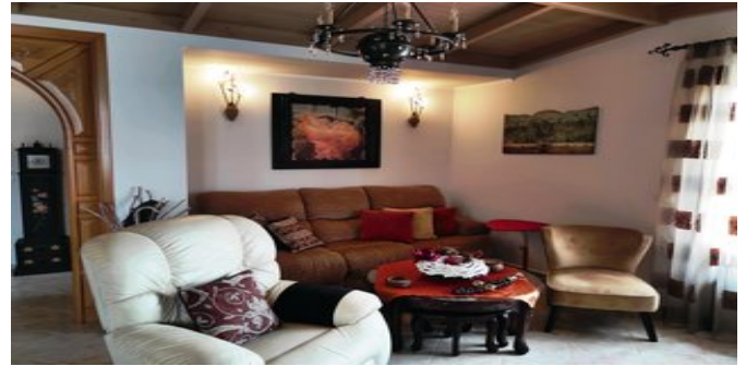
Eines der Schlafzimmer