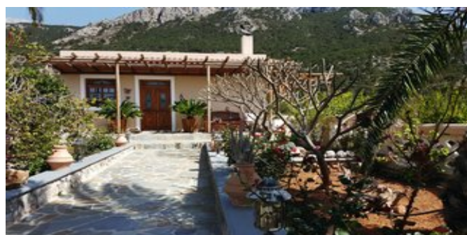
Die Reisis Family Residence