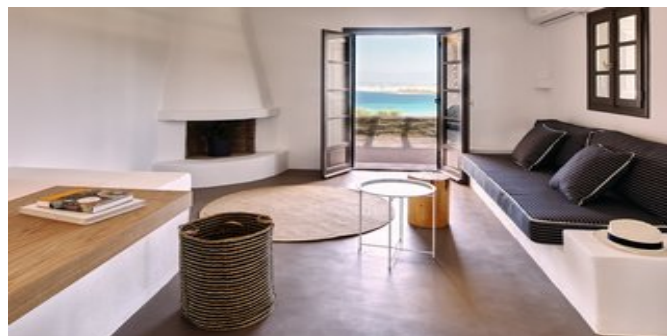
Wohnbeispiel Villa Turquoise - der Wohnbereich