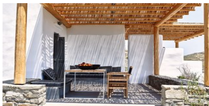
Wohnbeispiel Villa Turquoise - die Terrasse