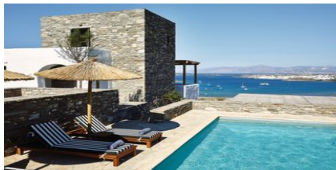
Wohnbeispiel Villa Sky - der Poolbereich

INDIGO 4-BEDROOM VILLA (VC) Ca. 170-200 qm. Für 2-9 Personen. Grundausstattung wie die Turquoise 2-Bedroom Villa. Auf 2 oder 3 Etagen angelegt. 2 Schlafzimmer mit Kingsize-Bett, 1 Schlafzimmer mit 2 Einzelbetten und 1 weiteres Schlafzimmer mit Kingsize-Bett oder 2 bis 4 Einzelbetten. Einige der Schlafzimmer befinden sich im Halbsouterrain. 3 x Bad oder Dusche/WC (eines davon en suite). Terrasse mit Privatpool, Liegen und Sonnenschirmen, Pooltücher. Meerblick.