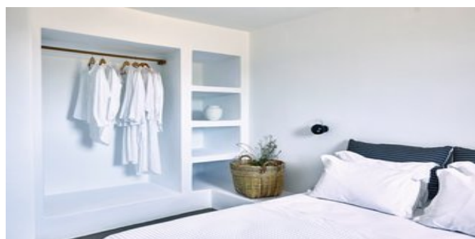
Wohnbeispiel Villa Sky - eines der Schlafzimmer