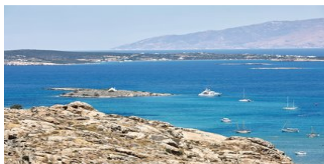
Blick auf das Meer