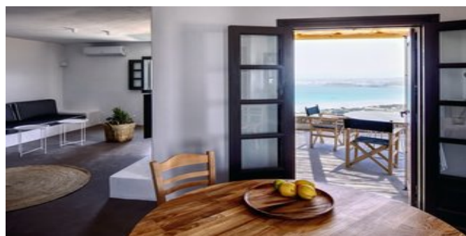
Wohnbeispiel Villa Turquoise - der Wohnbereich