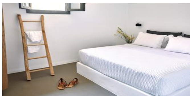
Wohnbeispiel Villa Turquoise - eines der Schlafzimmer