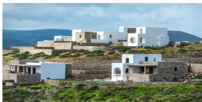
Blick auf die Acron Villas Paros