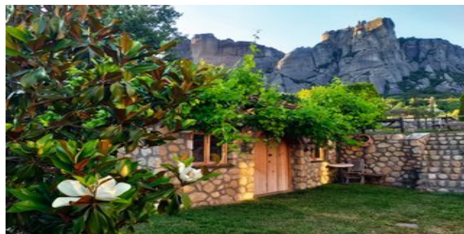
Garten der Ferienanlage

FAMILIEN ZIMMER (RD) Ca. 43 qm. Für 2 Erwachsenen und 2 Kinder. Grundausstattung wie die Zimmer, jedoch im Maisonnettestil angelegt, mit Parkettboden. Auf der unteren Ebene Wohn-/Schlafraum mit Doppelbett, Sitzecke, Kitchenette (zum Zubereiten von Kaffee und Tee) und Kamin. Über eine steile Treppe gelangt man