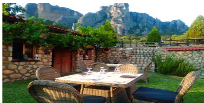
Garten der Ferienanlage