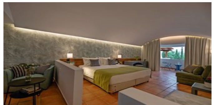
Wohnbeispiel Familien Bungalows