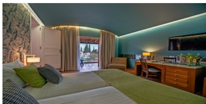
Wohnbeispiel Bungalows Privater Pool