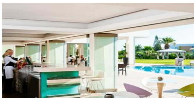
In der Bar