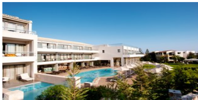
Das Castello Boutique Resort & Spa Hotel

JUNIORSUITEN (UA/UB) Ca. 45-50 qm. Für 2-3 Personen. Grundausstattung wie die Superiorzimmer, jedoch im Maisonette-Stil. Wohn-/Schlafbereich mit Schlafsofa für die 3. Person. Über eine Treppe erreichen Sie den offenen Schlafbereich mit Kingsize-Bett oder 2 Einzelbetten. Bad/WC mit Wanne oder Regendusche, Föhn, Bademantel, Slipper, Pflegeprodukte. Balkon oder Terrasse mit Blick zur Landseite (= UA) oder Terrasse mit privatem Pool und Blick zur Landseite (= UB).