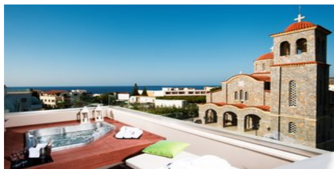
Ausblick vom Castello Boutique Resort & Spa Hotel