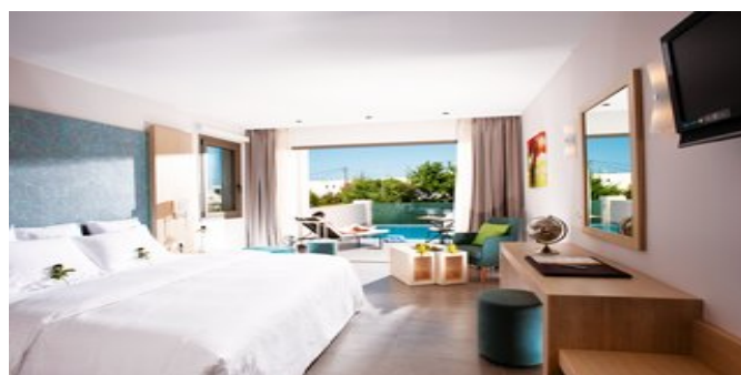
Wohnbeispiel Superior Zimmer mit privatem Pool