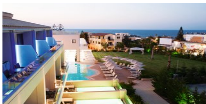
Ausblick vom Castello Boutique Resort & Spa Hotel