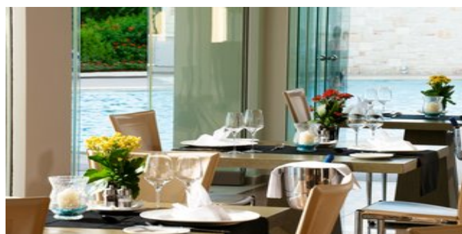
Im Restaurant "Elea"