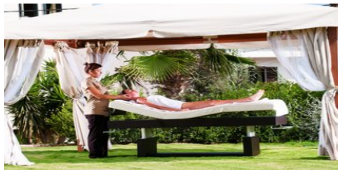
Zeit zum Entspannen