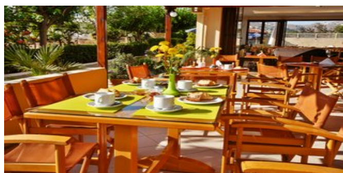
Auf der Terrasse der Cafébar