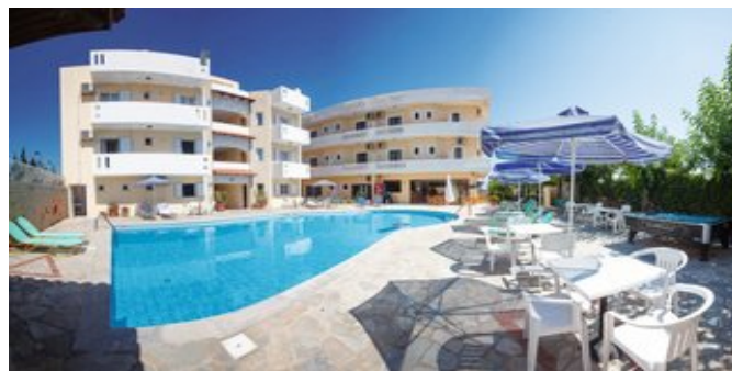
Das Dimitra Hotel & Apartments

SPARTIPP BEI PAUSCHALREISE Bei Buchung eines Attika Mietwagens ab/bis Flughafen Transfergutschrift EUR 34 pro Person. Einen Mietwagen der Kat. A1 erhalten Sie schon ab EUR 147 pro Woche.