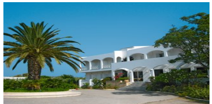
Das Hotel Mantenia