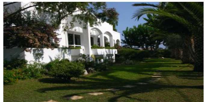
Das Hotel Mantenia