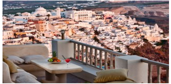
Blick von der "Lava Lounge" Terrasse