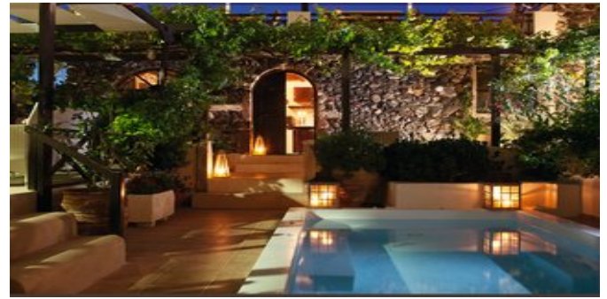
Der Jacuzzi im Herzen der Anlage