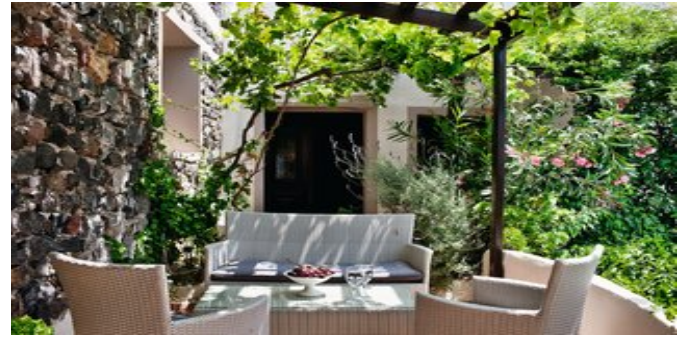
Auf der Terrasse

SUITEN (UB) Ca. 70 qm. Für 2-4 Personen. Grundausrüstung wie die Executivezimmer. Wohn-/Schlafrum mit 2 Schlafcouchen auf gemauerten Sockeln. 1 separater Schlafrum. Dusche/WC, Föhn, Pflegeprodukte, Bademantel, Slipper, Bügeleisen. Terrasse mit Sitzgelegenheit.