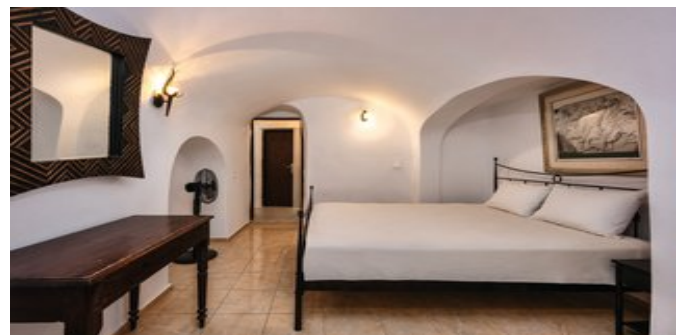
Wohnbeispiel Standard Suiten