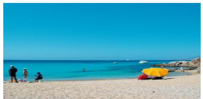
Der Strand von Aghios Prokópios