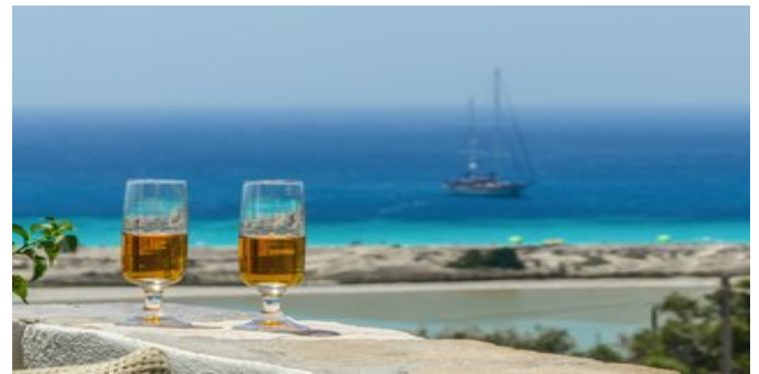
Blick auf das Meer