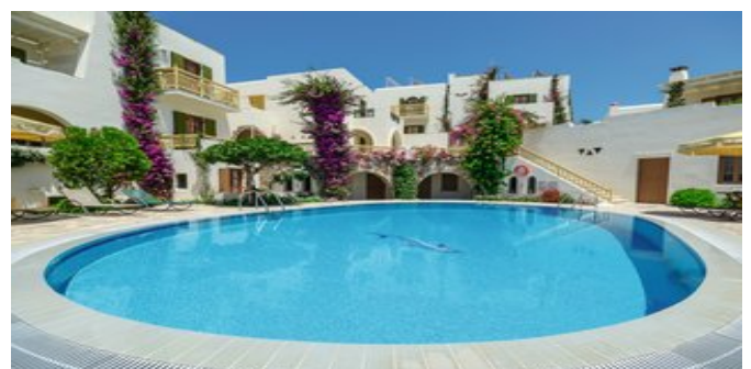
Die Anlage Proteas mit Pool