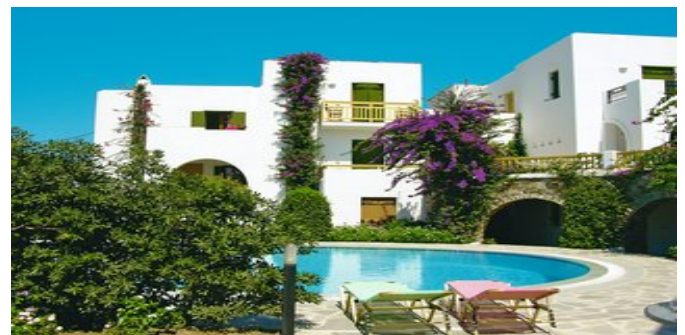
Die Hotel-Studios Proteas