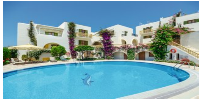
Die Hotel-Studios Proteas