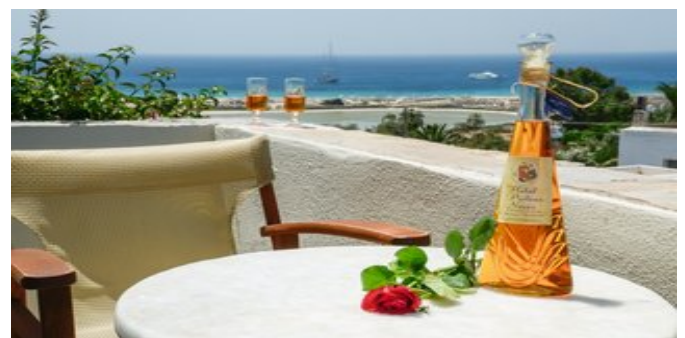
Auf dem Balkon