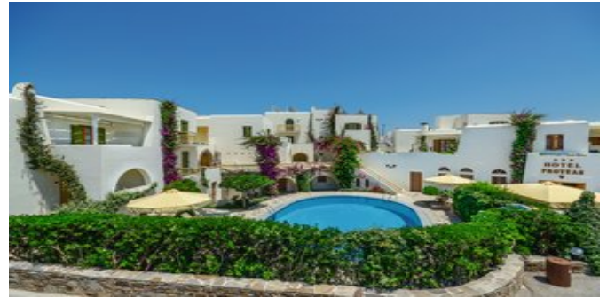
Die Hotel-Studios Proteas