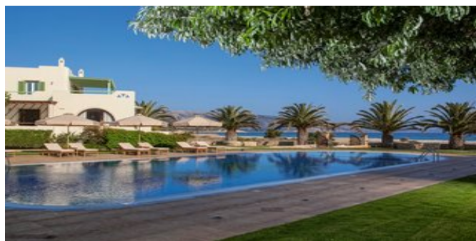
Das Hotel Finikas