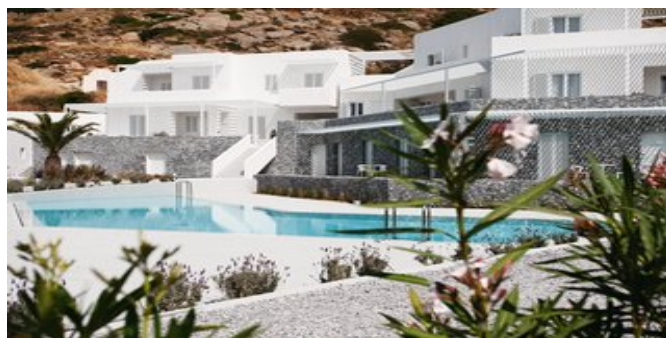
Das Hotel Relux Ios