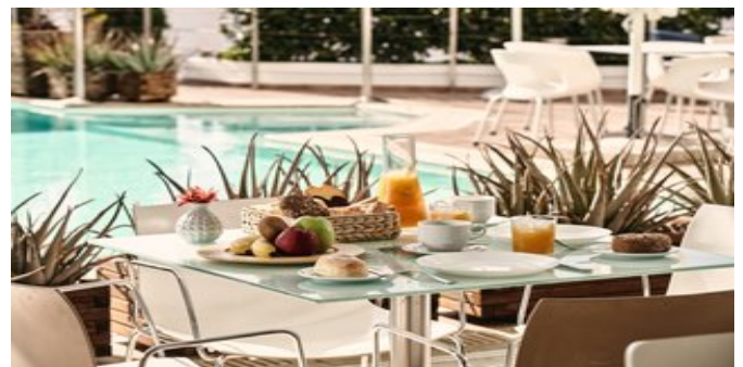
Frühstück mit Blick auf den Pool