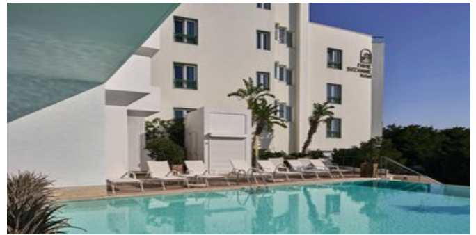
Die Anlage mit Pool