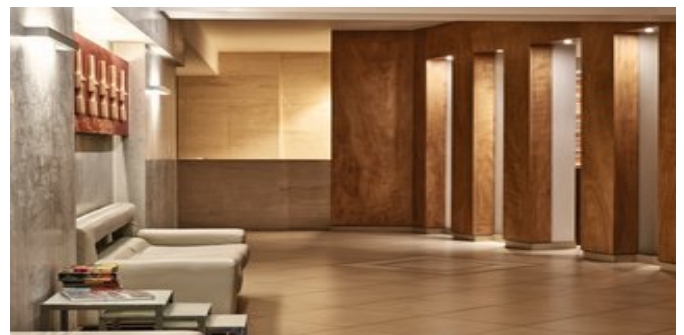
In der Lobby