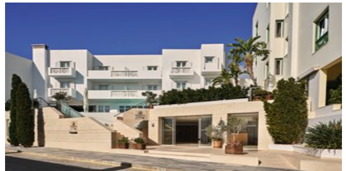
Das Oxygen Favie Suzanne Hotel