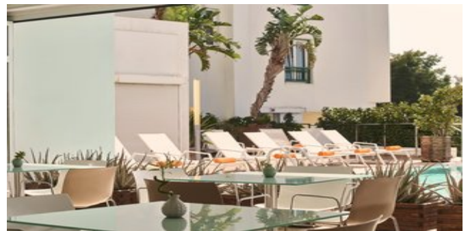
Ein Teil des Oxygen Favie Suzanne Hotels