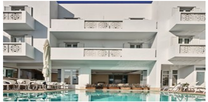
Das Oxygen Favie Suzanne Hotel mit Pool