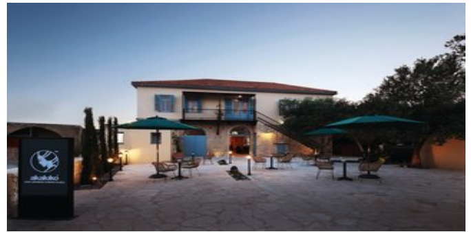
Das asiatische Fusion-Restaurant "Akakiko"

SPARTIPP Bei Buchung eines Attika Mietwagens Transfergutschrift ab/bis Flughafen Páphos EUR