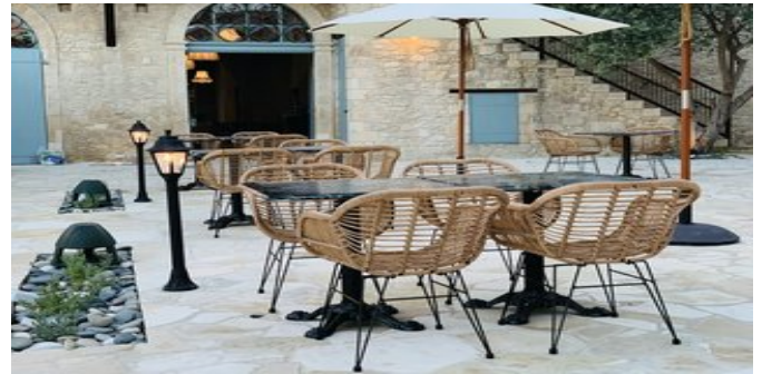
Asiatisches Fusion-Restaurant "Akakiko" - Terrasse