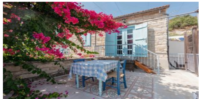
Auf der Terrasse