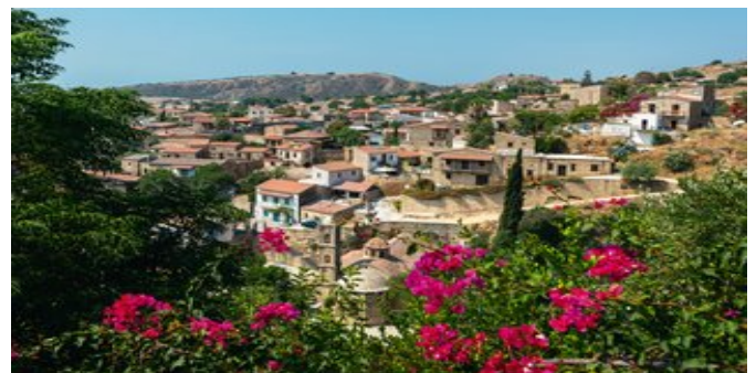
Blick über Tochni