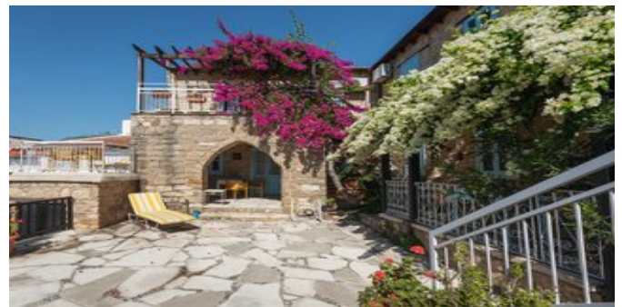
In einer der Anlagen