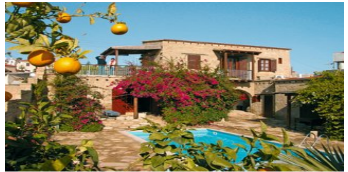
Eines der Häuser mit Pool

WELLNESS Gegen Gebühr: Sauna, auf Anfrage