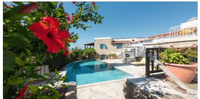
Blick auf den Pool