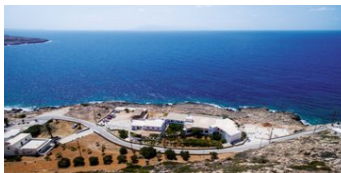
Blick über die Anlage