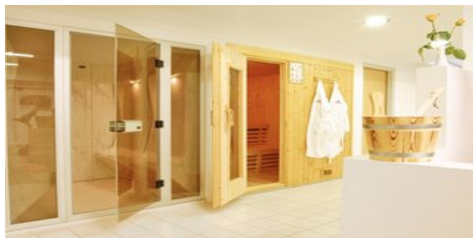
Der Saunabereich im Hotel Poseidon Palace