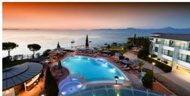
Das Hotel Poseidon Palace

ATTIKA SERVICE Transfer bei Pauschalreise inklusive.