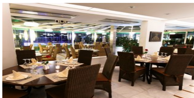
Das Restaurant im Hotel Poseidon Palace