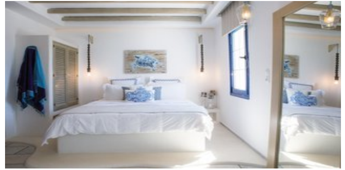
Wohnbeispiel Deluxe Suite

LOFTZIMMER KALLIOPE (RA) Ca. 20 qm. Für 2 Personen. Lage im Nebengebäude. Grundausstattung wie die Studios, jedoch auf 2 Ebenen. Wohnraum mit kleiner Kochnische (für die Zubereitung von Kleinigkeiten). Über eine Treppe erreichen Sie den offenen Schlafbereich mit Doppelbett auf einer eingezogenen Zwischendecke. Dusche/WC, Föhn. Privater Balkon mit Meerblick und Gemeinschaftsterrasse mit Meerblick.