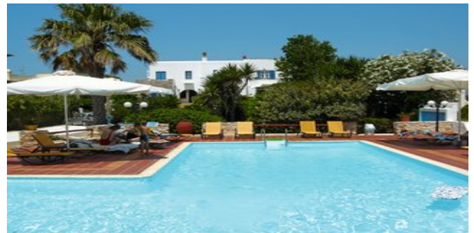
Die Studios Athina mit Pool

LUXURY APPARTEMENT 2 SCHLAFZIMMER II (AC) Ca. 40 qm. Für 2-4 Personen. Lage im Haupthaus. 2019 renoviert. Grundausstattung wie die Studios, jedoch moderner und hochwertiger eingerichtet. 2 Schlafzimmer, jeweils mit Doppelbett, die durch eine Milchglastür voneinander abgetrennt sind. Eines der Schlafzimmer mit kleiner Kochnische (für die Zubereitung von Kleinigkeiten). Offene Regenschauer-Dusche/WC, Föhn, Bademantel, Slipper, Pflegeprodukte, Strandtücher. Terrasse mit Gartenblick.