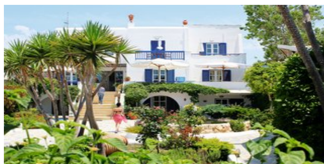
Die Studios Athina