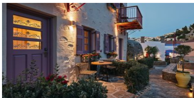
Abendstimmung im Kaminos Village Boutique Hotel