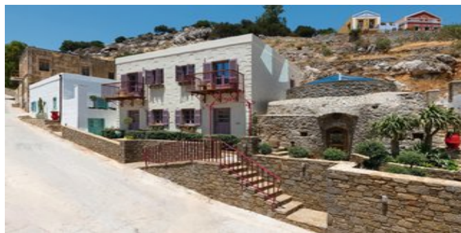
Ein Teil des Kaminos Village Boutique Hotels

SUITEN QUEENSIZE BETT (UB) Ca. 40-45 qm. Für 2-4 Personen. Grundausrüstung wie die Apartments. Unterschiedlich in Größe und individuell gestaltet. Wohn-/Schlafraum mit