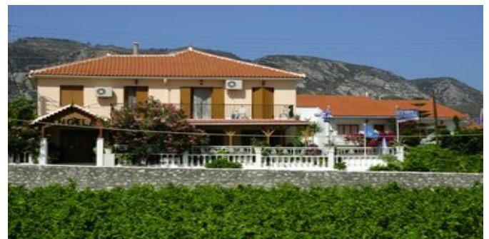
Die Appartements Angela