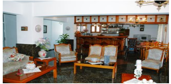
In der Lobby