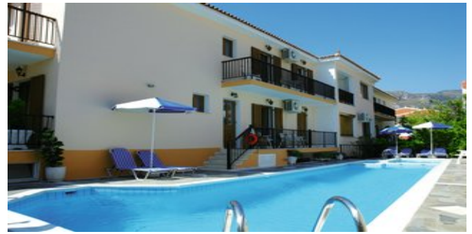
Blick auf den Pool