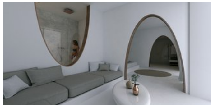
Wohnbeispiel Honeymoon Suiten (Modellskizze)