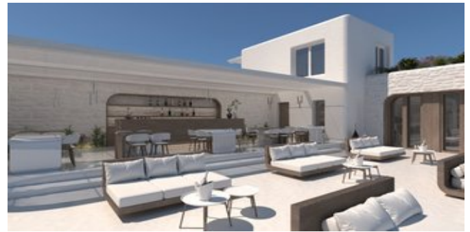
Die Bar (Modellskizze)

SPARTIPP Bei Buchung eines Attika Mietwagens ab/bis Flughafen Transfergutschrift EUR 46 pro Person. Einen Mietwagen der Kat. A1 erhalten Sie schon ab EUR 147 pro Woche.