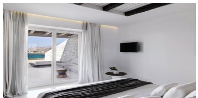
Wohnbeispiel Junior Suiten