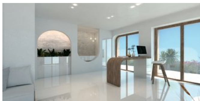
Die Rezeption (Modellskizze)