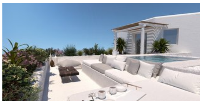
Wohnbeispiel Deluxe Zimmer (Modellskizze)