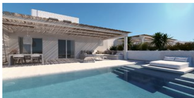
Wohnbeispiel Honeymoon Suiten (Modellskizze)