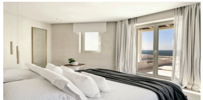
Wohnbeispiel Deluxe Zimmer