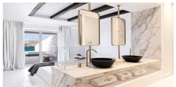
Wohnbeispiel Deluxe Zimmer