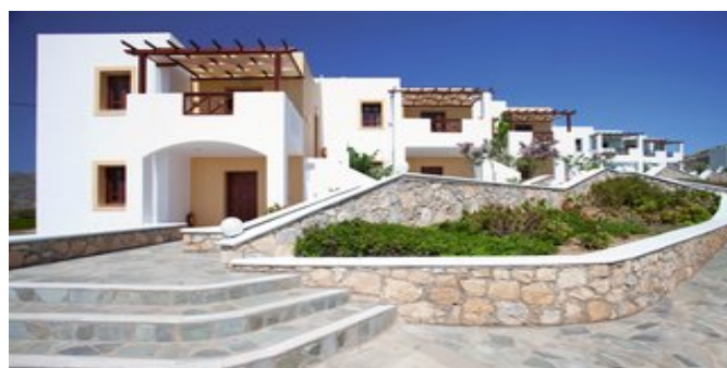
Die Anlage Golden Sun