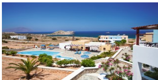
Blick über die Anlage