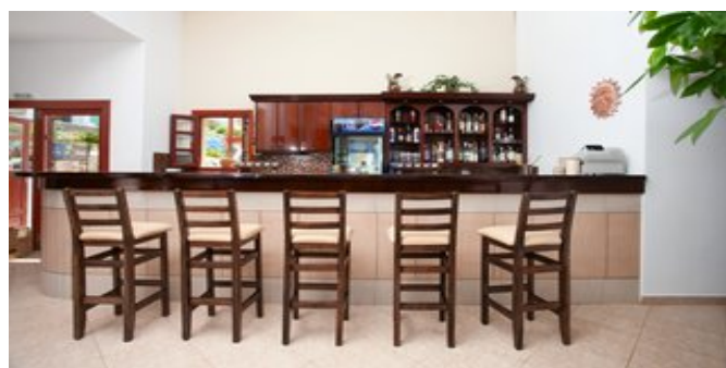
An der Bar