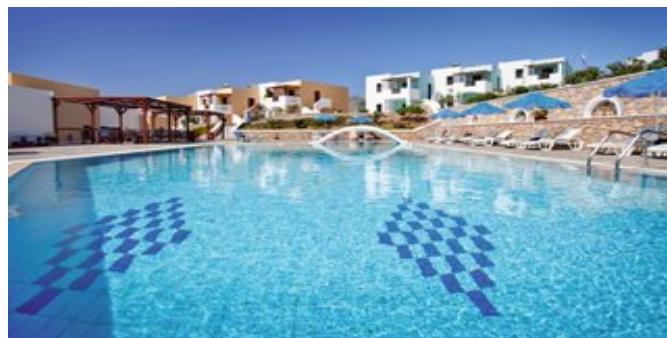
Die Golden Sun Hotel-Appartements mit Pool