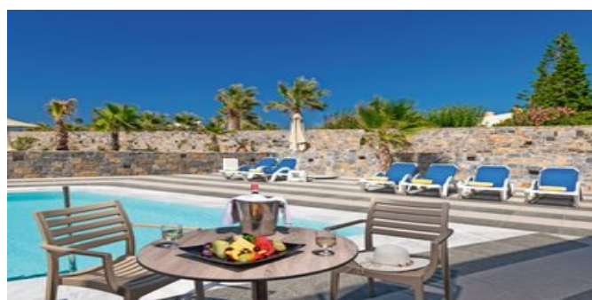
Familien-Maisonettes - Auf der Terrasse