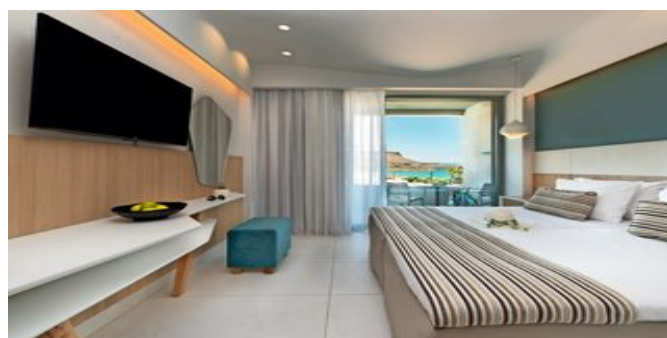
Wohnbeispiel Annex Zimmer