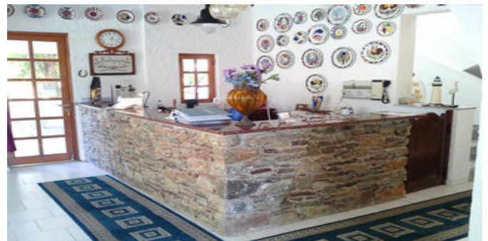
In der Lobby