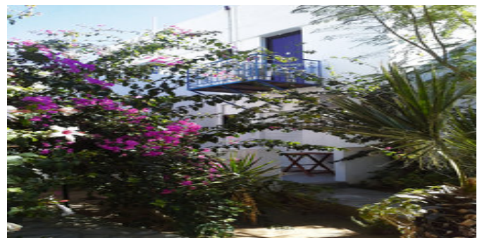
Die Anlage Irini