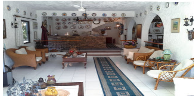
In der Lobby