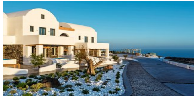
Das Elea Resort