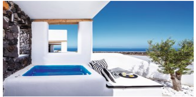
Wohnbeispiel Junior & Senior Jacuzzi Suiten