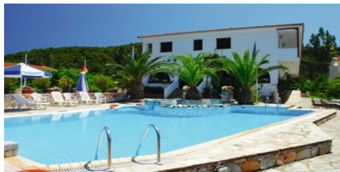
Das Hotel Afrodite mit Pool