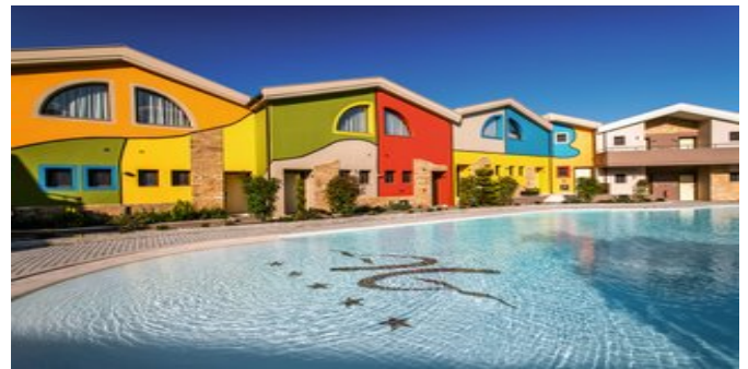
Alexandra Golden Boutique