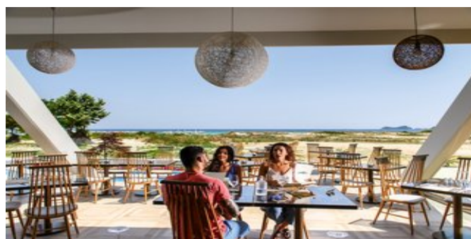
Im "Dunes" Strandrestaurant