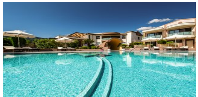
Alexandra Golden Boutique