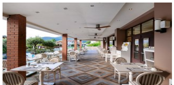
Im "Golden Frog" Restaurant