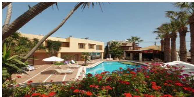
Die Anlage mit Pool