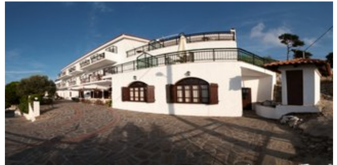
Das Hotel Ikaros Star