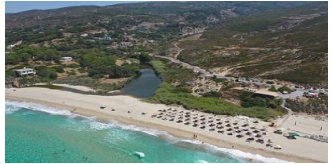
Blick auf den Strand