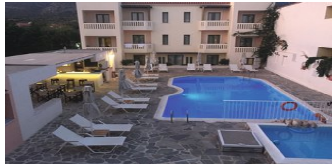
Das Aphrodite Hotel mit Pool