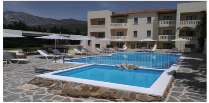
Das Aphrodite Hotel

STRAND Langer, flachabfallender Sand-/Kiesstrand. Liegen und Sonnenschirme können im Hotel tagesweise angemietet werden. Strandservice.