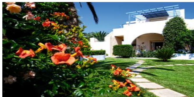
Die Appartements Papadakis

SPARTIPP Bei Buchung eines Attika Mietwagens ab/bis Flughafen Transfergutschrift EUR 46 pro Person. Einen Mietwagen der Kat. A1 erhalten Sie schon ab EUR 147 pro Woche.