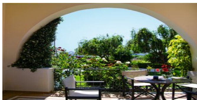
Terrasse eines Appartements