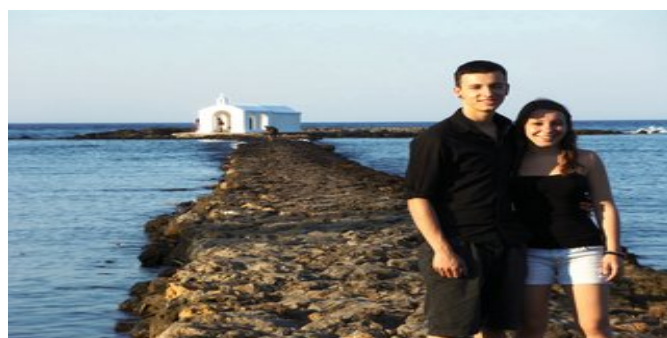
Kapelle bei Georgioupolis