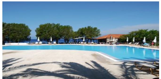
Der Poolbereich mit Taverna