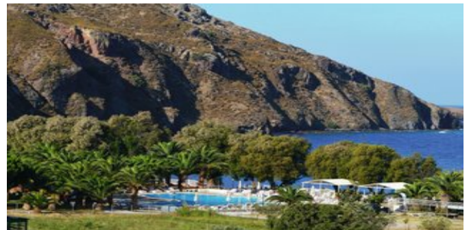
Blick auf das Meer