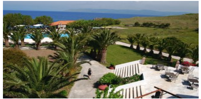
Blick über die Anlage