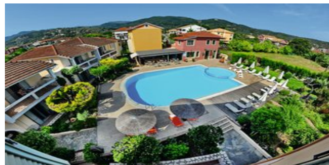
Blick auf die Anlage

SPARTIPP Bei Buchung eines Attika Mietwagens Transfergutschrift ab/bis Préveza EUR 78, ab/bis Hafen Igoumenítsa EUR 206 pro Person. Einen Mietwagen der Kat. A1 erhalten Sie schon ab EUR 140 pro Woche.