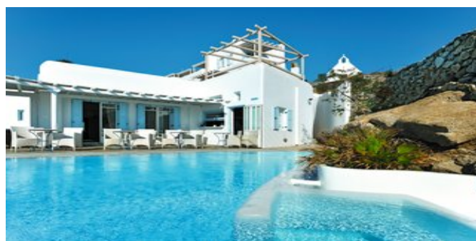
Das Hotel Deliades