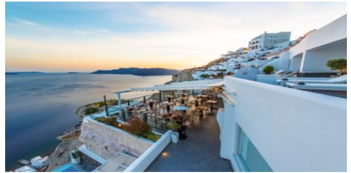
Blick von der Anlage