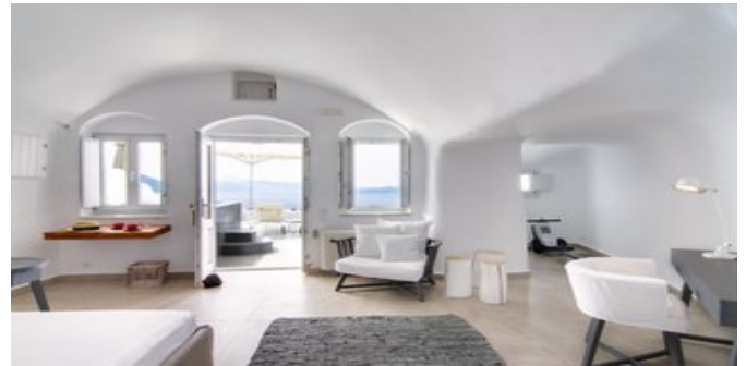
Wohnbeispiel Premium Suiten