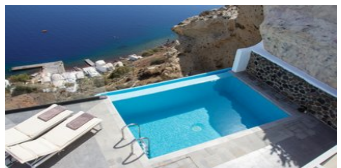
Wohnbeispiel Infinity Suiten