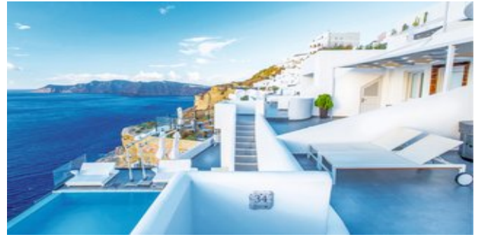
Das Santorini Secret Suites & Spa

ABSOLUTE SUITEN (UC) Ca. 45-50 qm. Für 2-3 Personen. Grundausrüstung wie die Pure Suiten, jedoch zusätzlich mit Schlafsofa für die 3. Person. Bad/WC oder Dusche mit Hydrojetmassage, Föhn,