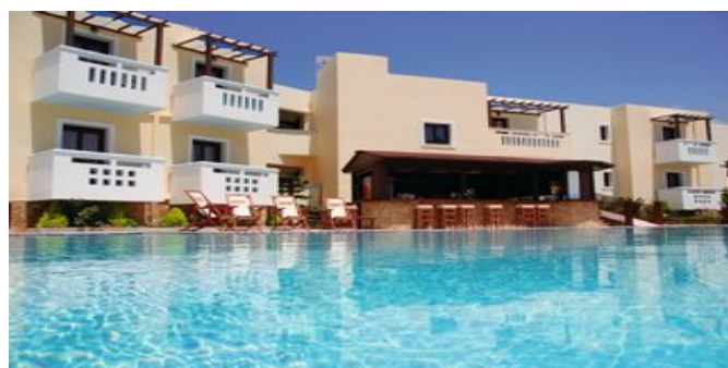
Das Hotel Arkasa Bay mit Pool