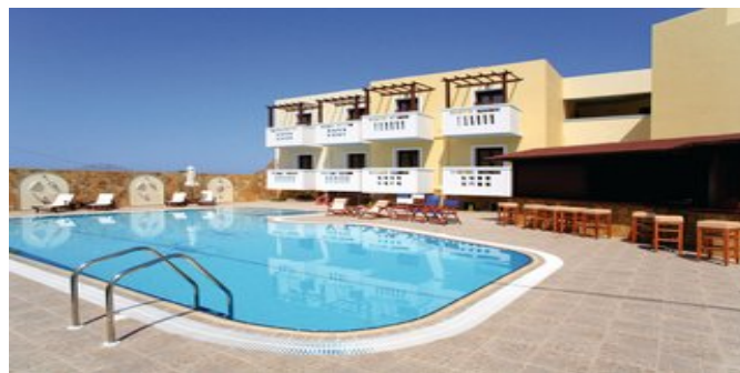
Das Arkasa Bay Hotel

STRAND Feinsandiger, teilweise flach abfallender