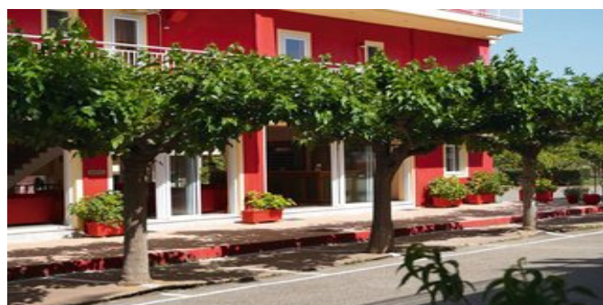
Das Hotel Brati-Arcoudi