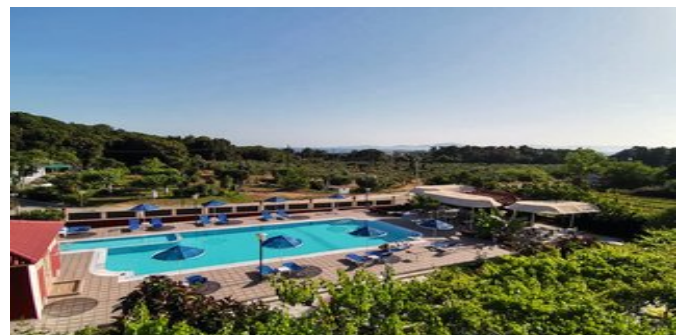
Blick auf den Poolbereich