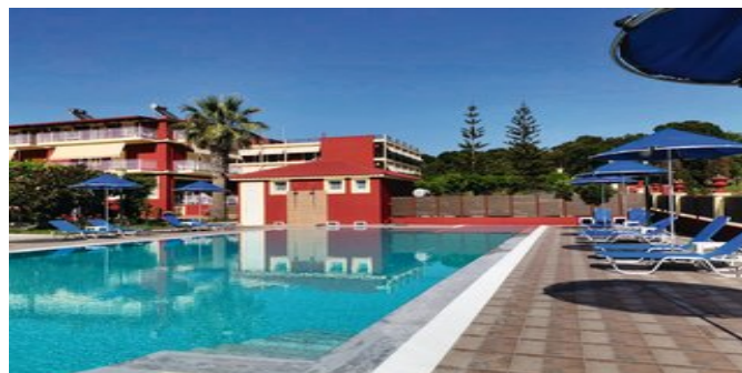
Ein Teil der Anlage mit Pool

SPARTIPP Bei Buchung eines Attika Mietwagens Transfergutschrift ab/bis Araxos EUR 112, ab/bis Kalamáta EUR 268 pro Person. Einen Mietwagen der Kat. A1 erhalten Sie schon ab EUR 147 pro Woche.